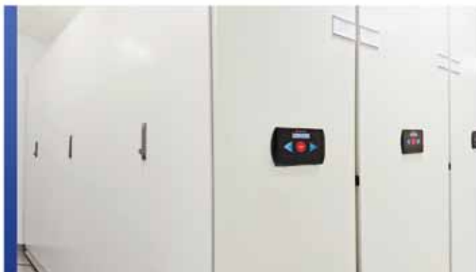
Rangement mobile motorisé

Pour économiser ou gagner de l'espace, nos systèmes de rangement mobiles offrent les toutes dernières fonctionnalités de conception et de sécurité pour accueillir vos collections uniques. Grâce aux systèmes de rangement électriques mobiles à haute densité, tirer le meilleur parti de votre espace alloué est un facteur clé, mais la sécurité est également essentielle. SafeAisle®, un système à la fine pointe de la technologie pour vos collections, vous offrira la tranquillité d'esprit sur ces deux aspects. Sa technologie LED Guard Technology MD vise à vous fournir la plus haute des sécurités en matière de rangement ainsi que pour votre personnel. Vous pouvez aussi sélectionner le système de rangement avec assistance mécanique Mobilex® haut de gamme de Montel, muni d'un frein de sécurité mécanique breveté, pour optimiser l'aire de rangement tout en maximisant vos inestimables collections.