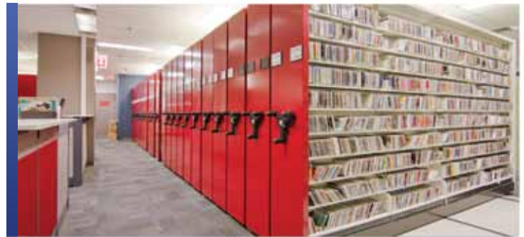
Rangement audiovisuel avec mobile et rayonnage 4-montants

Quelle que soit la nature ou la forme, Montel offre une solution de rangement pour collections de films et de matériel audiovisuel spécialement conçue pour assurer la préservation et la conservation des supports. Depuis les systèmes de rangement mobiles jusqu'aux systèmes de rayonnage fixes, nos solutions de rangement conçues sur mesure, avec un éventail de fonctionnalités et d'accessoires, fourniront une sécurité maximale et une excellente organisation pour les besoins de vos collections.