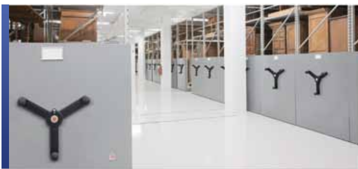
Collection de grandes tailles avec rangement mobile

Les systèmes de rayonnage fixes ou mobiles de grande envergure de Montel assurent le rangement sécuritaire des objets surdimensionnés et lourds. Les montants, supports et tablettes des étagères 4D de Montel sont conçus et fabriqués spécialement pour le marché des musées, car ils surpassent les normes de l'industrie en matière de flexibilité, soutiennent des charges plus lourdes et peuvent accueillir des objets de différentes hauteurs.