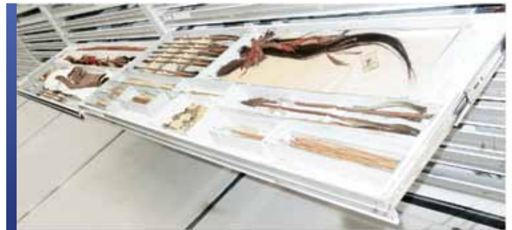
Spécimens historiques sur tiroirs coulissants

Certaines des créatures les plus fascinantes à avoir vécu sur Terre ne peuvent être vues aujourd'hui que sous la forme de spécimens conservés dans les musées. En fait, ce genre de collection présente un défi unique de rangement pour les musées en raison des dimensions et des formes inhabituelles des spécimens, et du fait qu'il peut y avoir présence de fluides. La manipulation n'est pas aussi simple que dans le cas d'autres artefacts secs. Avoir le système de rangement approprié contribue grandement à faciliter le travail.