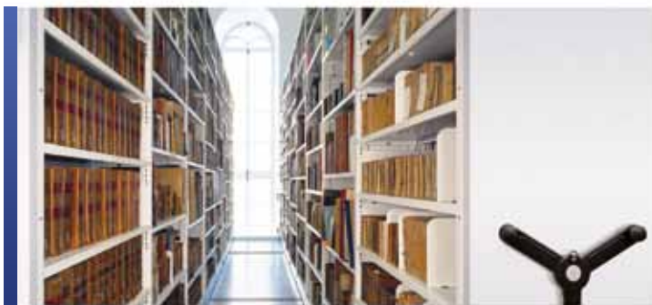
Rangement de livres rares avec mobile et rayonnage 4-montants

Chez Montel, nous savons que vous consacrez le même soin aux livres rares et aux manuscrits de vos collections. C'est pourquoi nous avons mis au point la référence en matière de rayonnage innovant pour veiller à ce que vos documents d'histoire, de littérature, de musique, d'art, de sciences et d'histoire naturelle soient préservés et gérés de manière appropriée. Grâce à nos solutions de rangement spécialisées, vos parchemins, vos encyclopédies, votre littérature, votre poésie, vos romans et vos boîtes et archives sont entre bonnes mains.