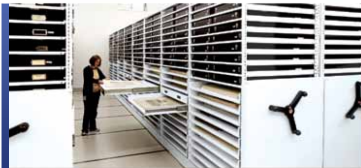
Collection d'imprimés et de dessins avec mobile et rayonnage 4-montants

Offrir un bon environnement, une manipulation sécuritaire et un rangement efficace est essentiel à la préservation de vos collections d'imprimés et de dessins. Puisqu'il vaut mieux ranger les objets en papier à plat plutôt que de les plier et déplier, ce qui peut conduire à la formation de crevasses et de déchirures, Montel offre un large éventail de méthodes de rangement afin de bien protéger vos collections.