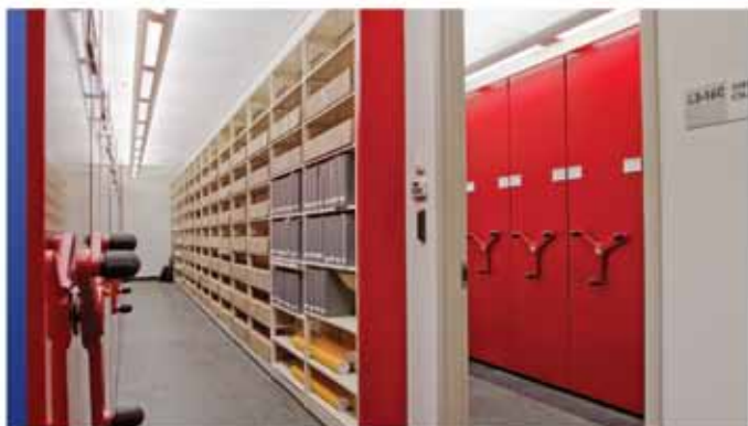
Rangement mobile pour collection spéciale