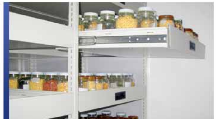
Tiroirs coulissants pour collection de spécimens