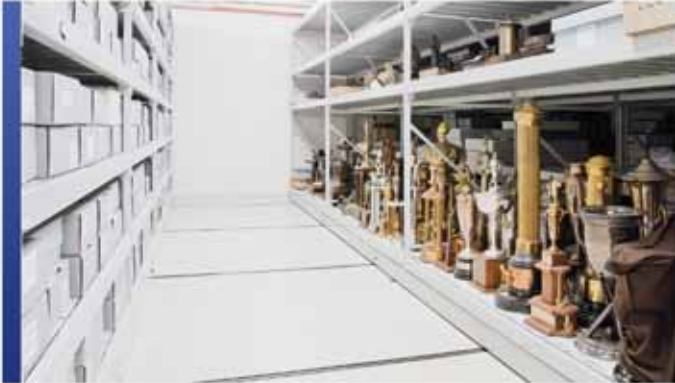
Rangement mobile avec rayonnage 4D longue portée