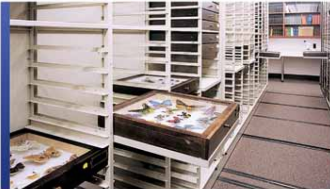
Rangement spécialisé pour spécimens

Chez Montel, nous sommes pleinement conscients de nos responsabilités lorsque nous proposons, élaborons et construisons des systèmes de rangement uniques qui doivent préserver non seulement des œuvres d'art de valeur, mais aussi l'intégrité et l'essence même des installations qui les abritent.