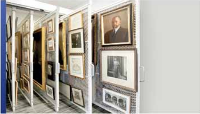
Kit de rangement de tableaux ModulArt™