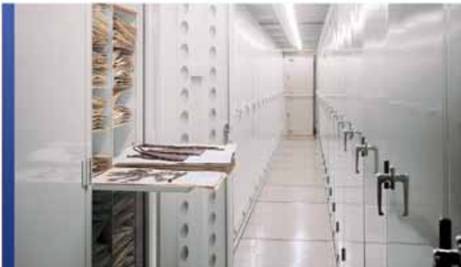
Cabinets de rangement pour herbiers

Quelles que soient vos collections à ranger, Montel peut offrir une gamme variée de cabinets soigneusement conçus pour répondre à vos besoins particuliers. Avec une conception flexible et un large éventail d'options, notre vaste sélection de cabinets permettra de protéger vos collections les plus précieuses tout en économisant l'espace au sol.