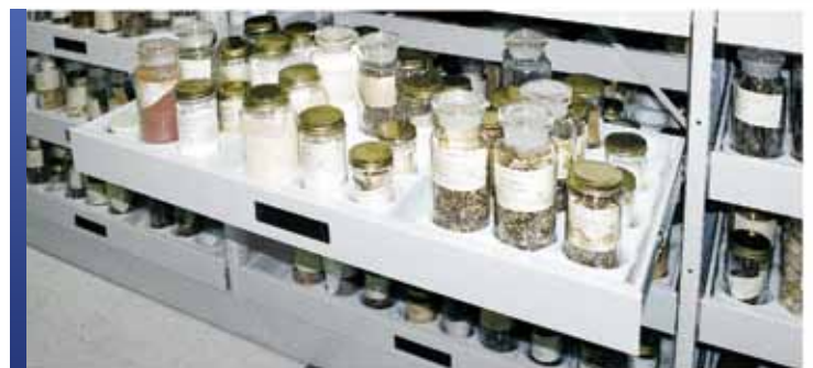
Tiroirs pour collection de spécimens

En intégrant à la gestion de votre musée notre large gamme de rayonnages et d'armoires à haute densité fixes et mobiles, vous pouvez optimiser et personnaliser le rangement de spécimens dans votre établissement. Pour le plaisir des générations futures, Montel fournit des systèmes de rangement et de soins de collections qui constituent une méthode plus sûre et plus efficace pour préserver ces précieux échantillons biologiques.