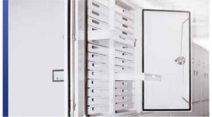
Cabinets de rangement pour artefacts et spécimens

Quelles que soient vos collections à ranger, Montel peut offrir une gamme variée de cabinets soigneusement conçus pour répondre à vos besoins particuliers. Avec une conception flexible et un large éventail d'options, notre vaste sélection de cabinets permettra de protéger vos collections les plus précieuses tout en économisant l'espace au sol.