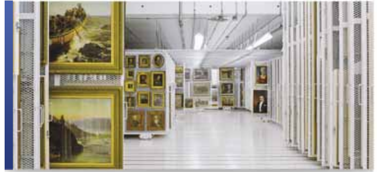
Panneaux de rangement coulissants fixés au plancher

Facilitant la gestion des collections et aidant à prévenir les dommages coûteux, les panneaux coulissants de Montel sont devenus le système de panneaux de rangement de choix pour de nombreux musées et galeries de renom.