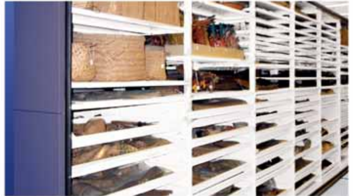
Collection anthropologique sur rayonnage 4-montants

Chez Montel, nous sommes pleinement conscients de nos responsabilités lorsque nous proposons, élaborons et construisons des systèmes de rangement uniques qui doivent préserver non seulement des œuvres d'art de valeur, mais aussi l'intégrité et l'essence même des installations qui les abritent.