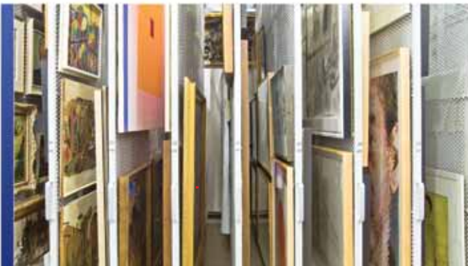
Panneaux de rangement coulissants

Pour vos collections de peintures et d'œuvres d'art encadrées conservées dans un espace limité, ModulArt MD est un produit autonome sur roues qui vous permet d'ajouter des unités modulaires à mesure que vos besoins de rangement augmentent. Pour les plus grandes surfaces et autres applications permanentes, utilisez nos panneaux latéraux de rangement mobiles ou panneaux coulissants fixés au plancher pour optimiser l'utilisation de votre espace disponible. Si vous préférez ne pas avoir de rails sous les pieds ou ne pas apporter de modifications à votre plancher existant, optez plutôt pour des panneaux de rangement coulissants suspendus au plafond.