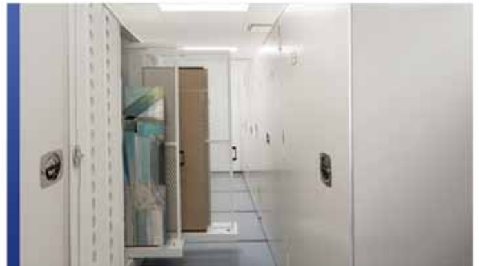
Cabinets de rangement pour textiles