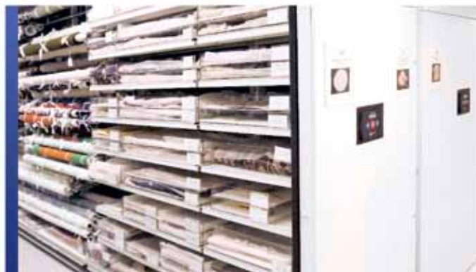
Rangement mobile motorisé pour collection de vêtements et tissus