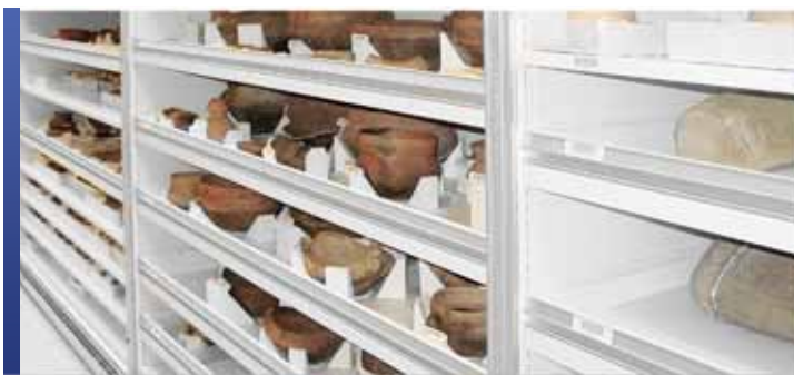
Tiroirs robustes pour artefacts