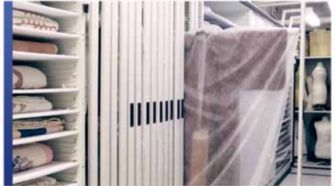
Rangement spécialisé pour collection de vêtements

De l'anthropologie à la zoologie, les produits de rangement de Montel font une utilisation intelligente de votre espace afin de bien gérer les artefacts, les spécimens, les peintures, les photos, les sculptures, les cadres, les archives, les fichiers, les dossiers, les boîtes et bien plus encore. Faites confiance à Montel pour vous aider à maîtriser l'art du rangement.