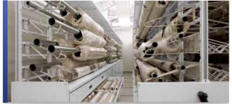
Collection de tissus avec rayonnage cantilever

Qu'il s'agisse d'ameublement, de décorations, de vêtements ou d'art, le rangement sécuritaire des collections de vêtements et de textiles présente un défi qui est commun à ce genre d'articles de collection. Malheureusement, les vêtements et les textiles sont parmi les plus fragiles de tous les artefacts. Les insectes, les moisissures, la manipulation et l'exposition à la lumière, la chaleur et l'humidité endommagent facilement ce genre de collection.