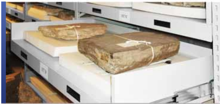
Collection d'artefacts sur tiroirs conçues sur mesure

Avec une flexibilité et un réglage infinis, Montel offre ses étagères de rangement SmartShelf exclusives et conçues de façon unique. Grâce à une vaste sélection de tablettes et d'accessoires, SmartShelf permet des solutions de rangement innovantes et sûres pour tous les types de collections. Comme dispositif autonome ou installé sur nos chariots mobiles, ce système de rayonnage veillera à ce que les collections d'artefacts et d'objets 3D soient correctement rangées pour une protection à long terme.