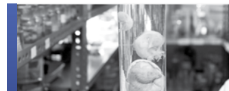
Collections dites humides