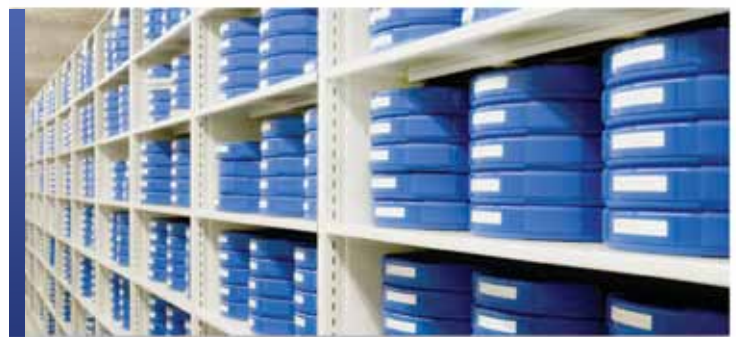
Rangement spécialisé pour collection de films