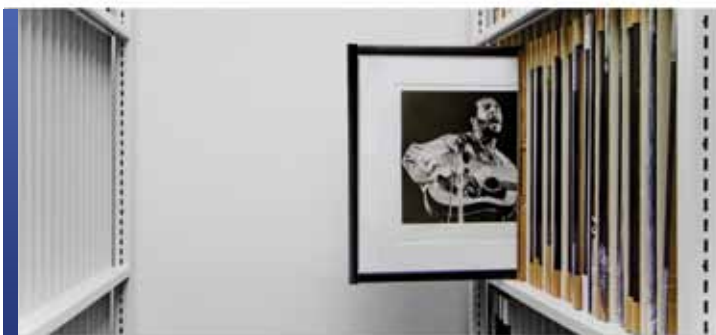
Rangement spécialisé pour collection d'imprimés

Pour vos travaux distingués sur papier qui prennent de l'âge, notre vaste gamme de systèmes de rayonnages mobiles et stationnaires de haute technicité offre des caractéristiques de conception et de flexibilité afin d'optimiser et de conserver en toute sécurité vos précieuses collections. Pour mieux accueillir les imprimés et les dessins, des tiroirs et des plateaux offerts en plusieurs configurations permettent d'assurer que vos précieuses collections sont correctement rangées et protégées, pour une conservation et une sécurité maximales.