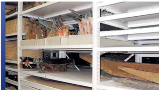
Collection d'artefacts avec rayonnage 4-montants

Que vous recherchiez des solutions de rangement mobiles ou des applications stationnaires traditionnelles, permettez-nous de partager les détails uniques des systèmes de rayonnage exclusifs de Montel, qui offrent une flexibilité, une force et une rigidité supérieures. Peu importe la forme et la taille, vous pouvez compter sur notre système de rayonnage hybride à quatre poteaux SmartShelf®, notre système de rayonnage cantilever Aetnastak® ou notre rayonnage 4D grande portée pour la préservation et la sécurité maximales de vos collections.