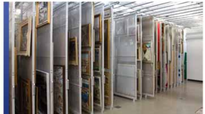
Panneaux de rangement coulissants suspendus au plafond