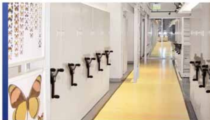
Rangement mécanique assisté

Pour économiser ou gagner de l'espace, nos systèmes de rangement mobiles offrent les toutes dernières fonctionnalités de conception et de sécurité pour accueillir vos collections uniques. Grâce aux systèmes de rangement électriques mobiles à haute densité, tirer le meilleur parti de votre espace alloué est un facteur clé, mais la sécurité est également essentielle. SafeAisle®, un système à la fine pointe de la technologie pour vos collections, vous offrira la tranquillité d'esprit sur ces deux aspects. Sa technologie LED Guard Technology MD vise à vous fournir la plus haute des sécurités en matière de rangement ainsi que pour votre personnel. Vous pouvez aussi sélectionner le système de rangement avec assistance mécanique Mobilex® haut de gamme de Montel, muni d'un frein de sécurité mécanique breveté, pour optimiser l'aire de rangement tout en maximisant vos inestimables collections.