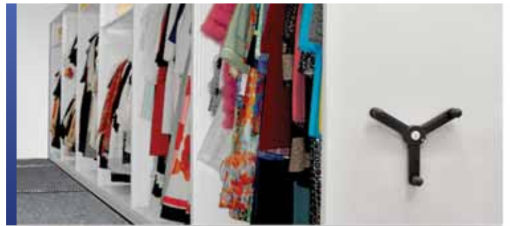
Rangement mobile pour collection de vêtements

Puisque nous accordons de la valeur aux vêtements et textiles historiques parce qu'ils documentent l'art et l'artisanat et ont un lien très direct avec les gens du passé, Montel comprend que, comme pour toute œuvre d'art et artefact, la préservation commence par un rangement approprié. Grâce à notre vaste gamme de systèmes de rayonnage mobiles et fixes et armoires de rangement, nous pouvons optimiser et personnaliser le rangement lié aux textiles.