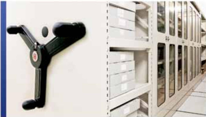
Cabinets de rangement sur système mobile

Près de 90 ans d'expérience combinées au talent et au dévouement de son équipe de spécialistes ont permis à Montel d'acquérir sa réputation d'excellence à titre de fournisseur de systèmes de rangement pour les musées, les sociétés d'histoire, les galeries d'art et les temples de la renommée.