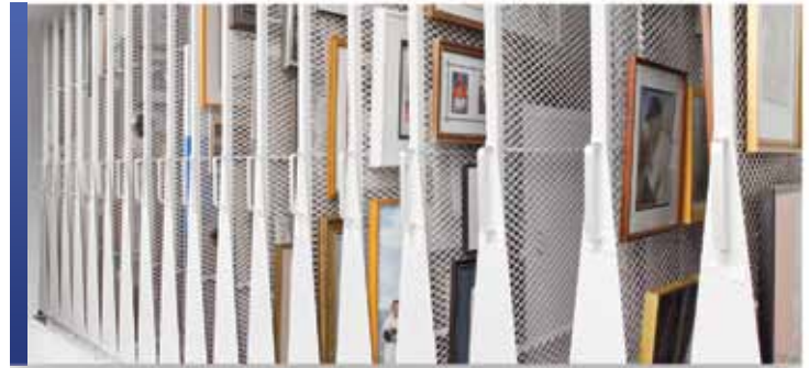
Panneaux latéraux de rangement mobiles