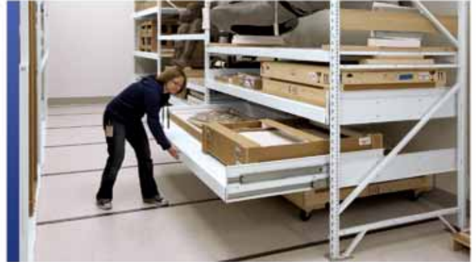
Tiroirs spécialisés pour collection d'artefacts

Que vous recherchiez des solutions de rangement mobiles ou des applications stationnaires traditionnelles, permettez-nous de partager les détails uniques des systèmes de rayonnage exclusifs de Montel, qui offrent une flexibilité, une force et une rigidité supérieures. Peu importe la forme et la taille, vous pouvez compter sur notre système de rayonnage hybride à quatre poteaux SmartShelf®, notre système de rayonnage cantilever Aetnastak® ou notre rayonnage 4D grande portée pour la préservation et la sécurité maximales de vos collections.