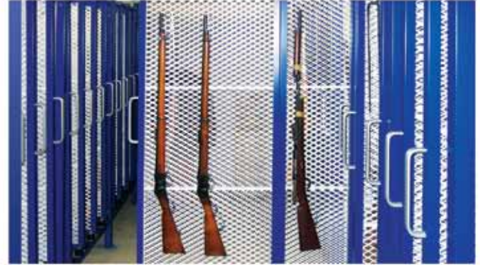
Kit de rangement de tableaux ModulArt™

Pour vos collections de peintures et d'œuvres d'art encadrées conservées dans un espace limité, ModulArt MD est un produit autonome sur roues qui vous permet d'ajouter des unités modulaires à mesure que vos besoins de rangement augmentent. Pour les plus grandes surfaces et autres applications permanentes, utilisez nos panneaux latéraux de rangement mobiles ou panneaux coulissants fixés au plancher pour optimiser l'utilisation de votre espace disponible. Si vous préférez ne pas avoir de rails sous les pieds ou ne pas apporter de modifications à votre plancher existant, optez plutôt pour des panneaux de rangement coulissants suspendus au plafond.