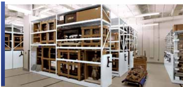
Rangement mobile avec rayonnage 4D longue portée