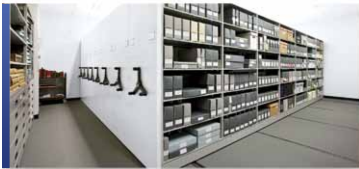
Rangement d'archives avec mobile et rayonnage 4-montants

Montel comprend l'importance des besoins en matière d'entretien et de conservation des collections dans les musées d'aujourd'hui. Quand il s'agit de créer des solutions innovantes et rentables pour les collections de livres rares, de manuscrits et d'archives, Montel ouvre la voie avec des solutions de rangement polyvalentes mobiles et fixes qui font une utilisation efficace des zones limitées de rangement des musées tout en facilitant l'utilisation efficace des étagères et l'extraction.