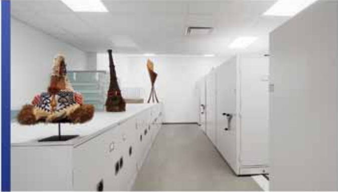
Cabinets de rangement pour la conservation